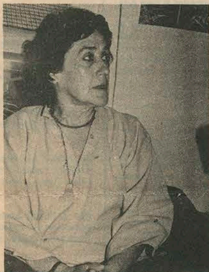
Isidora Aguirre, la laureada dramaturga chilena, autora de "Lautaro", nuevo montaje teatral que se incorpora a la cartelera de la capital.

por la autora de "La pérgola de las flores" y que obtuvo en 1981 el primer premio del concurso de obras teatrales organizado por la Universidad Católica.