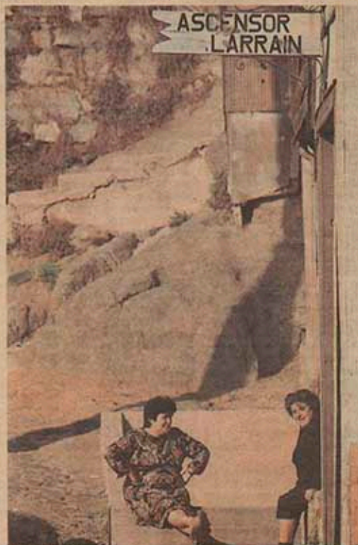
Apegados a los cerros, los ascensores son parte de lo más cotidiano del puerto.

Para ellos un "ascensor" es parte fundante de la vida del puerto, compañía cotidiana y posibilidad de escape a lugares diferentes: un mirador desde donde podrá contemplar la ciudad y la bahía, un barrio popular con un laberinto de calles siempre pintorescas y cambiantes o un barrio señorial. Todo en un simple viaje de ascensor. □