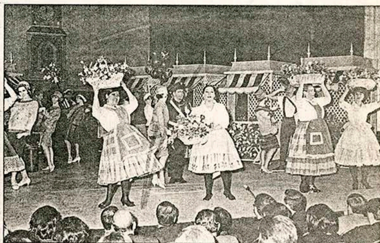
● Montaje cubano para una pérgola con sabor caribeño: esta clásica obra chilena también se hizo en Argentina, con elenco de ese país.

El éxito de "La pérgola..." fue inmediato y dura hasta nuestros días: las canciones de Francisco Flores del Campo todavía se recuerdan y la "Carmelita" es un símbolo de la "pureza natural", representado en una niña de largas trenzas que