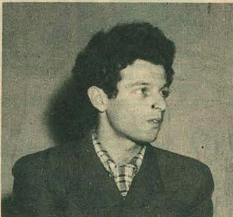
ALEJANDRO JODOROWSKY, actor, director de teatro, director de cine, se ha abierto paso internacionalmente con su "teatro Pánico"

La Secretaría de Relaciones Culturales del Gobierno y el Teatro de la Universidad Católica acaban de dar forma a un acuerdo para crear el Teatro Itinerante cuya primera obra, "Romeo y Julieta", (traducción de Pablo Neruda) comenzará ya a darse en las regiones del norte de Chile.