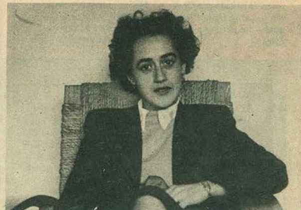
ISIDORA AGUIRRE, dramaturga y maestra de teatro. ¿Cuándo romperá su silencio?

La fuerza de esta tradición pareciera haberse debilitado. Los escritores se abstienen de escribir para la escena y de enviar a los concursos. El reciente Concurso Nacional de Teatro debió extender sus plazos en treinta días (se falla el 30