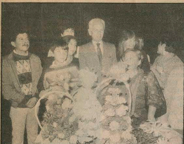
Gustavo Alessandri, alcalde de Santiago, rodeado de las pergoleras.